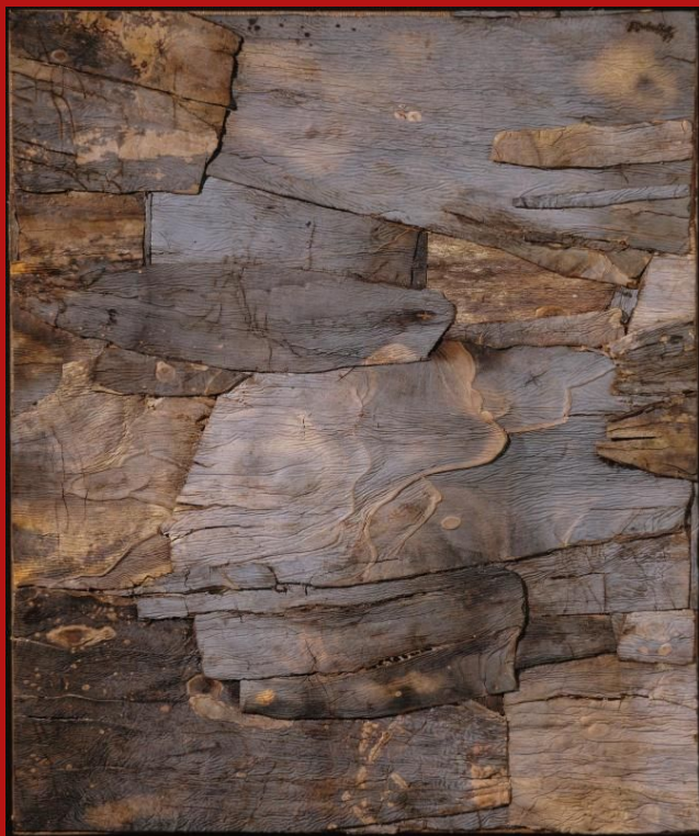
Jean Dubuffet, La Mer de peau , décembre 1959