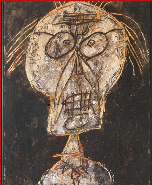
Jean Dubuffet, Dhôtel nuancé d'abricot , juillet-août 1947