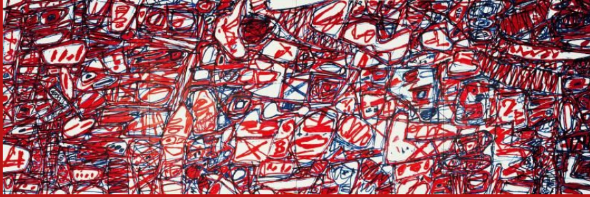
Jean Dubuffet, Le Cours des choses - Mire G 174 (Boléro) , 22 décembre 1983