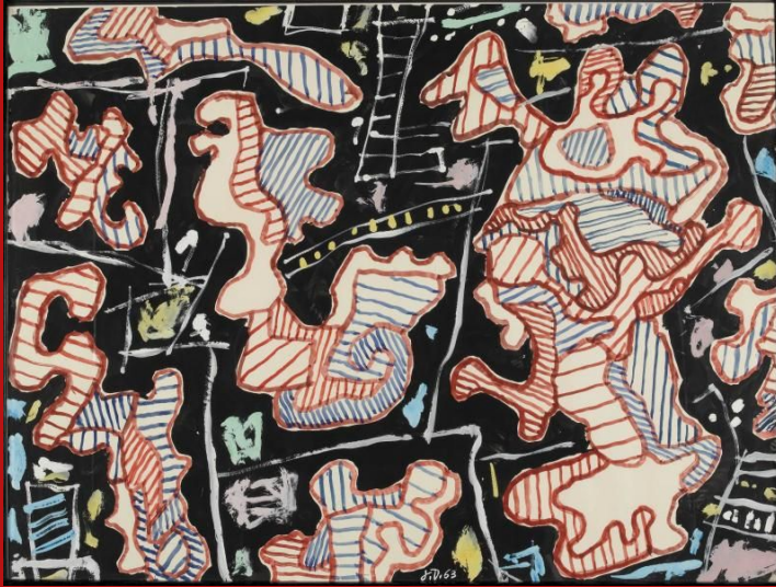
Jean Dubuffet, Locus agitatus , 6 février 1963