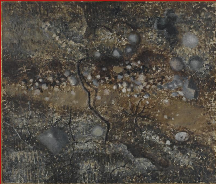
Jean Dubuffet, Fond de rivière , 1927