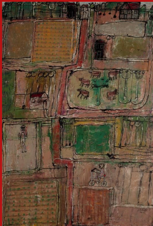
Jean Dubuffet, Campagne heureuse , août 1944