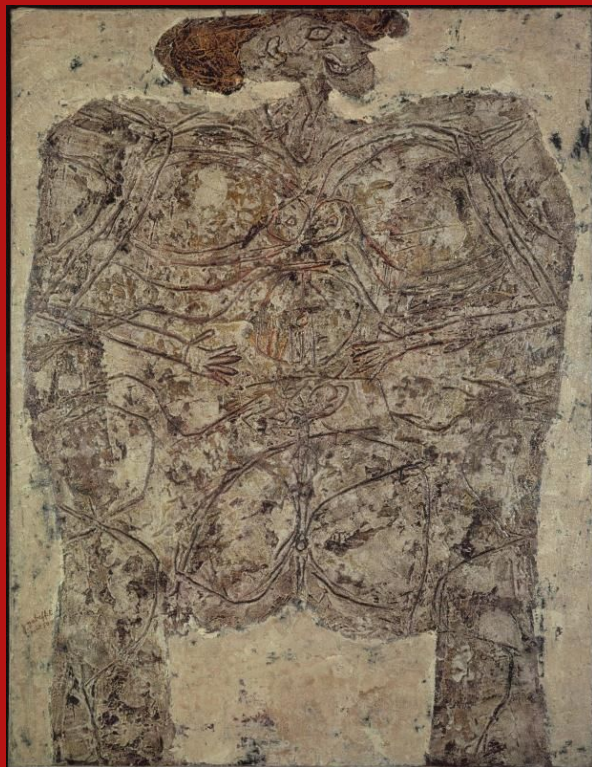
Jean Dubuffet, Le Métafizyx , août 1950