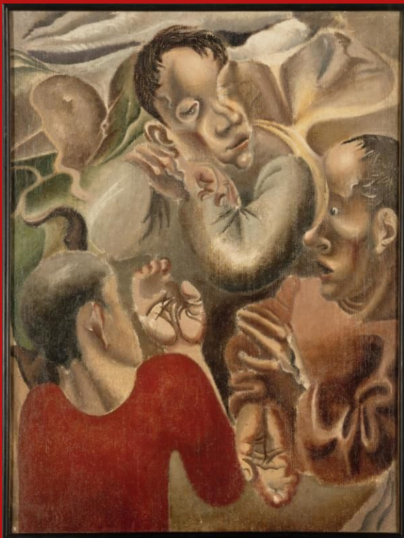
Jean Dubuffet, Trois personnages dans un paysage , 1924-1925