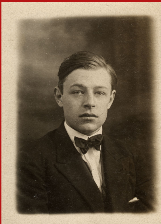
Photographe non identifié, Jean Dubuffet à 18 ans, Paris, 1919