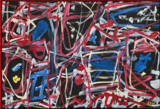
Jean Dubuffet, Passe flux (Non-lieu L 50) , 22 novembre 1984